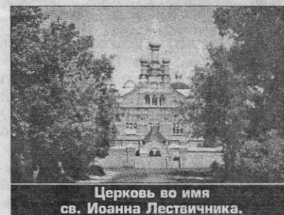
Церковь во имя св. Иоанна Лествичника.