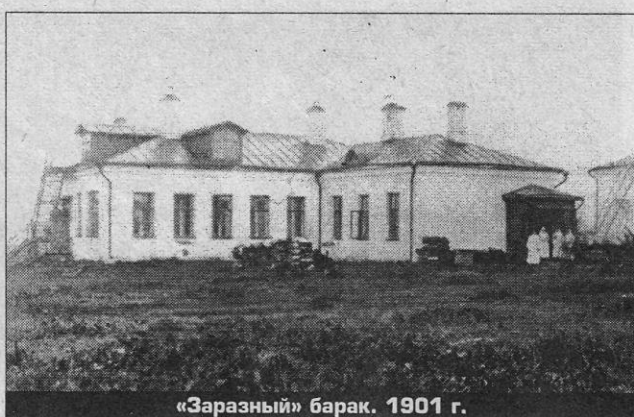
«Заразный» барак. 1901 г.