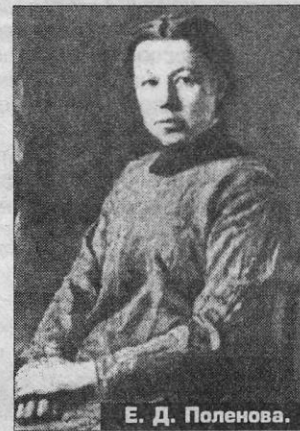
Е. Д. Поленова.

15 ноября 1850 г. (150 лет назад) родилась Елена Дмитриевна Поленова (1850 - 1898) — художница, чье имя тесным образом связано с Абрамцевым. В Абрамцеве Поленова занималась керамикой, живописью, художественной резьбой по дереву, писала акварельные пейзажи, иллюстрировала книги, была художником-костюмером, собирала произведения устного народного творчества и крестьянского бытового искусства. Здесь, среди собратьев по искусству, она создала самые лучшие свои работы.