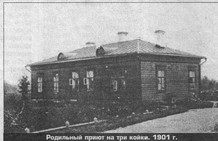
Родильный приют на три койки. 1901 г.