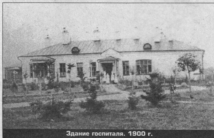
Здание госпиталя. 1900 г.