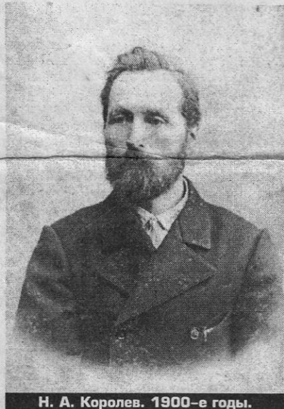
Н. А. Королев. 1900-е годы.