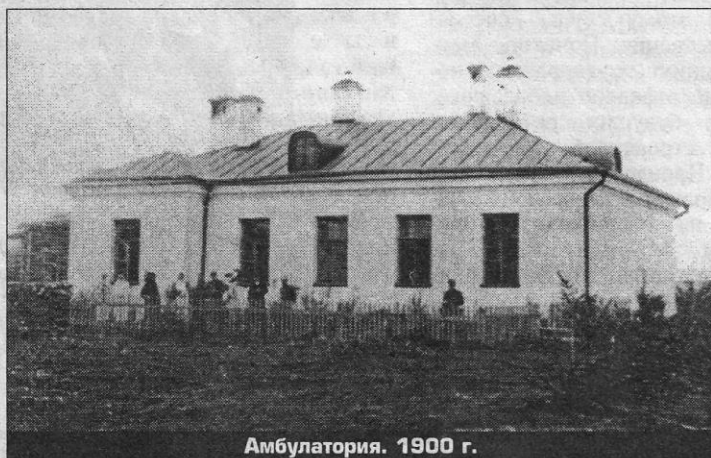
Амбулатория. 1900 г.