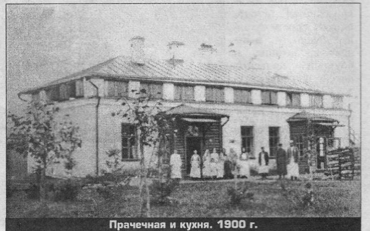
Прачечная и кухня. 1900 г.