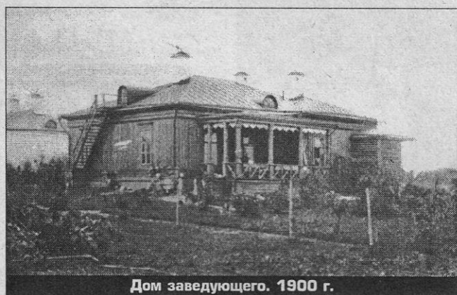
Дом заведующего. 1900 г.