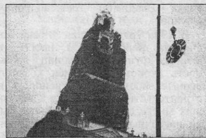
Установка циферблата часов на колокольню. 6 октября 2000 г.

3 (16) ноября 1905 г. (95 лет назад) завершилась работа по установке новых башенных часов на лаврской колокольне. Доставил в Лавру и установил часы хозяин московской часовой фирмы А. А. Энодин. Старые часы, установленные тульским мастером Кобылиным, действовали с 1784 г.